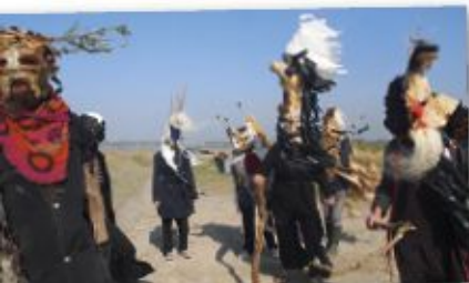
Atelier masques © Nelson-Estibill

Gratuit, ouvert à tous (plus d'info au dos du programme)