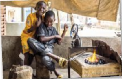
Visages de Bamako

14H-16H30 SAVOIR FAIRE-ENSEMBLE au Centre Social du Plateau Activités créatives variées et goûter spécial « Carnets d'Afrique ». Gratuit, sur inscription au Tél. 02 96 31 61 80